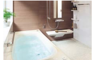
省エネ、お手入れカンタンな システムバス