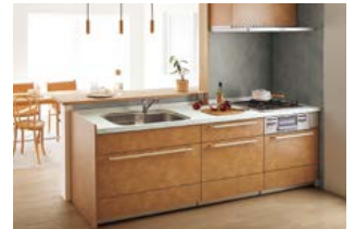
高品質なシステムキッチン