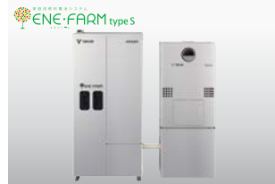
エネファームでマイホーム発電

東邦ガスグループがお届けする、 安心低金利“あったかリフォームローン”。 お客さまのリフォームの大きな夢を サポートいたします。